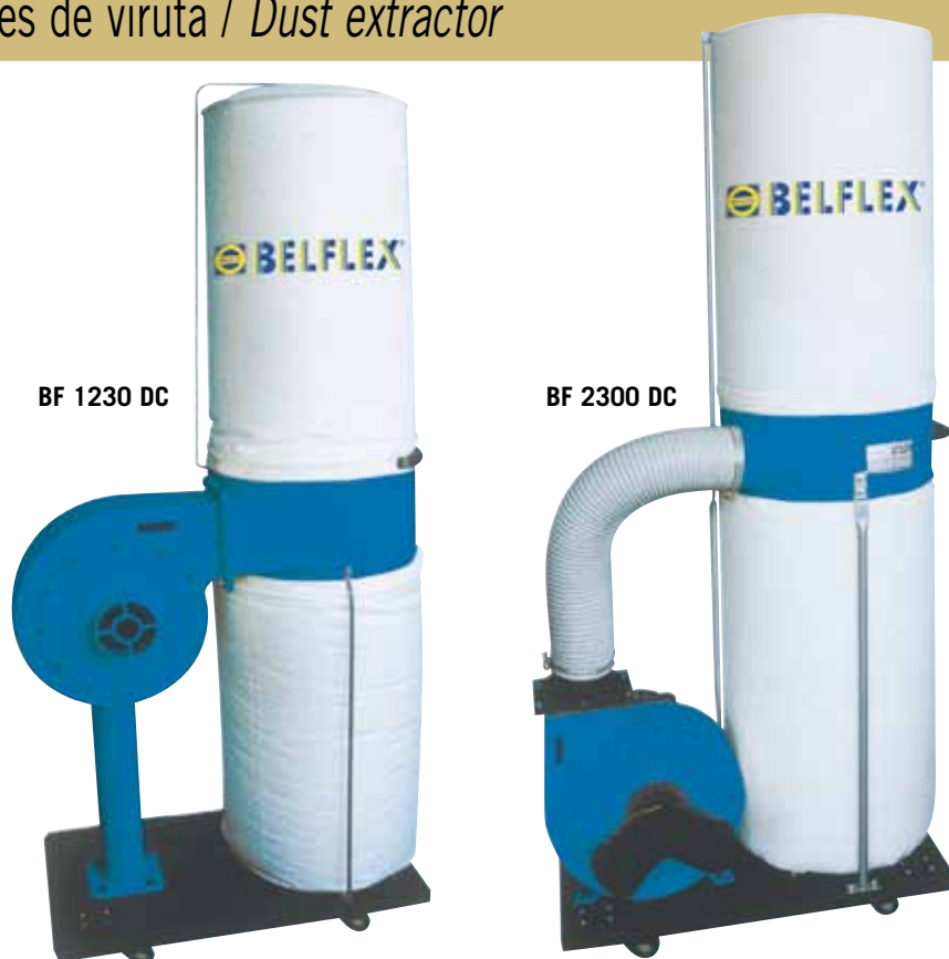
BF 1230 DC