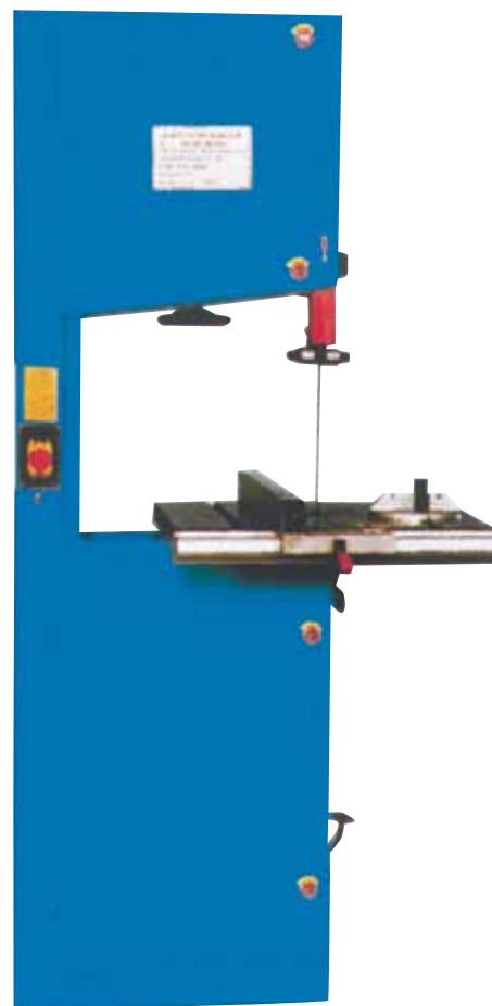
BF 345 SC